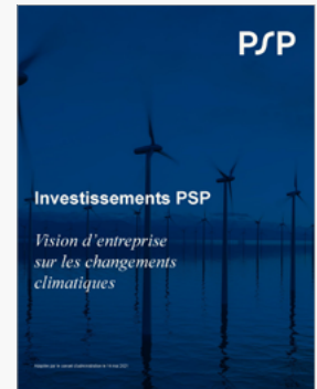
Vision d'entreprise de PSP sur les changements climatiques