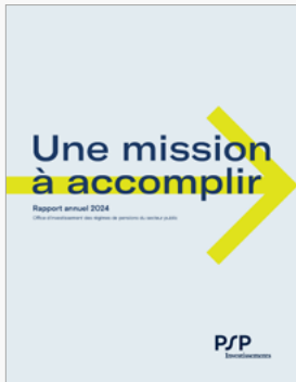
Rapport annuel 2023 PSP