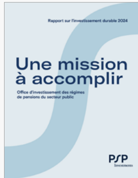
Rapport sur l'investissement durable 2024 PSP