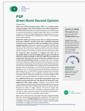
PSP Green Bond Second Opinion – CICERO Shades of Green (anglais uniquement)