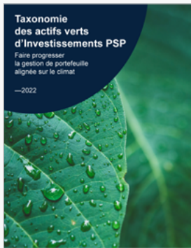
Taxonomie des actifs verts d'Investissements PSP