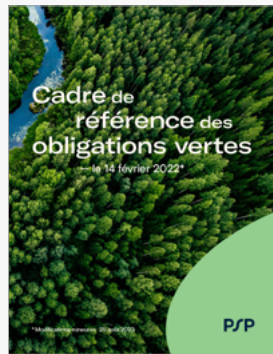
Cadre de référence des obligations vertes PSP