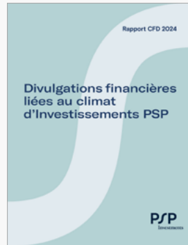
Divulgations financières liées au climat d'Investissements PSP